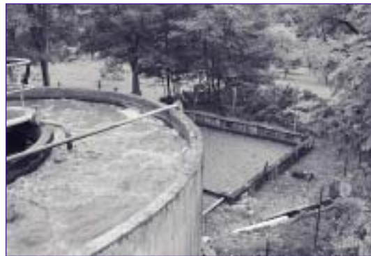
Vue de la station d'épuration et du lit de séchage pour la déshydratation des boues