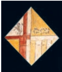
Anne de Joyeuse